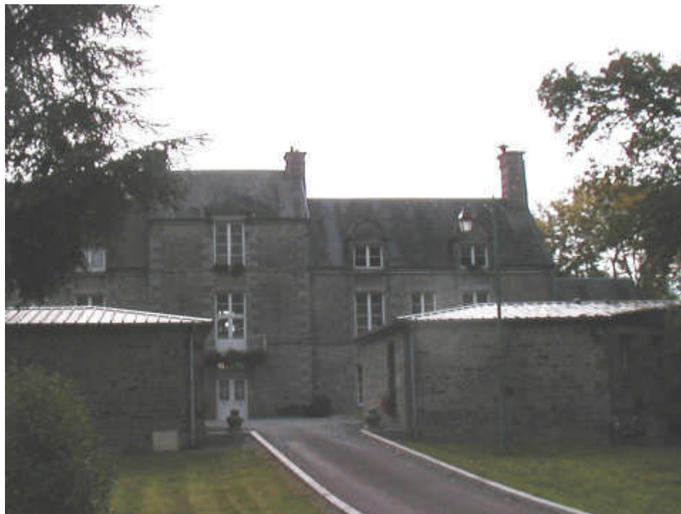
CHATEAU de MONTBRAY

BULLETIN DES RADIOAMATEURS ET ECOUTEURS DE LA MANCHE