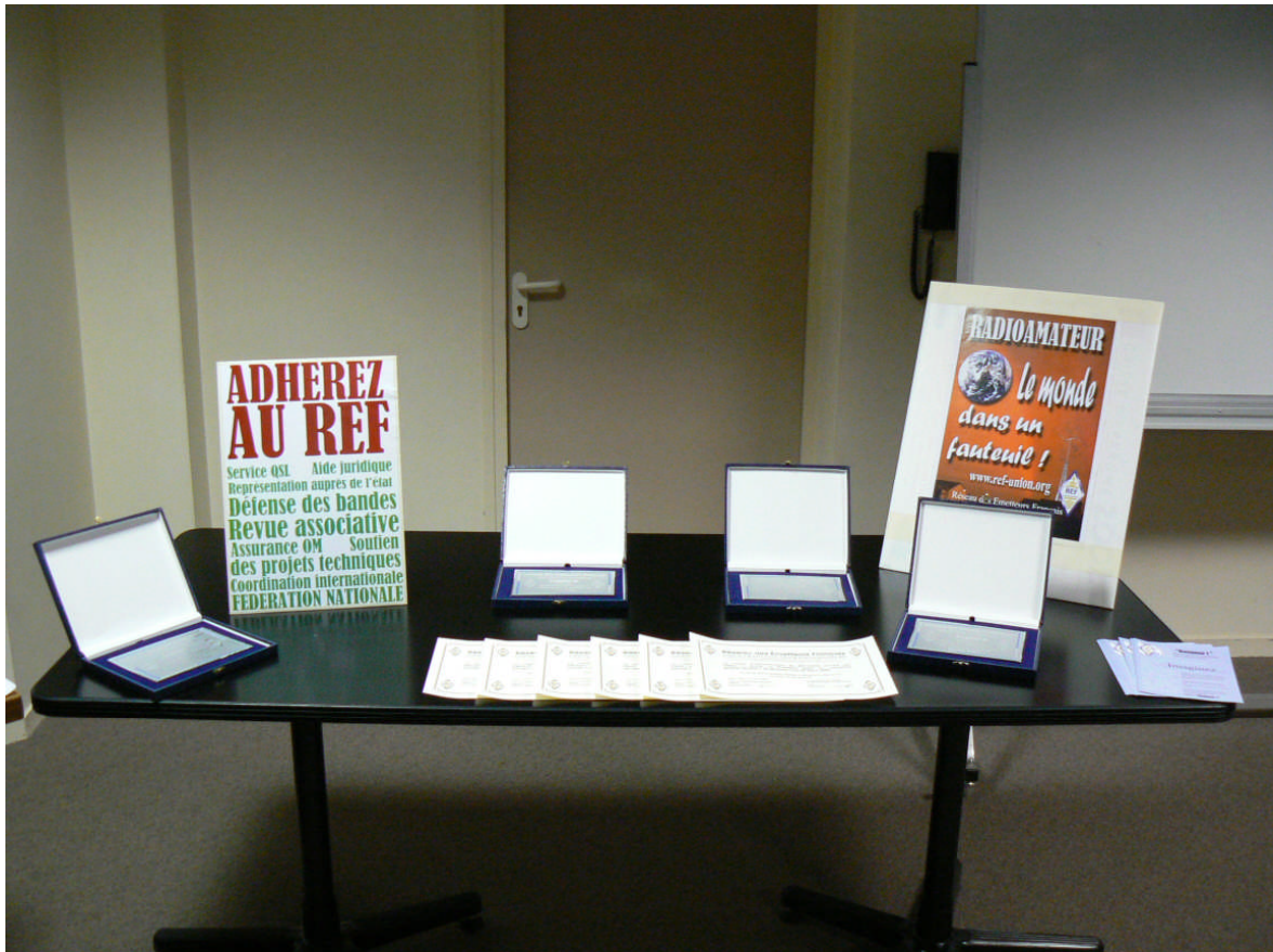
Les Plaques et Diplômes

Suivant les vœux de l'assemblée, une aide de 46.26€ sera donnée au RUR 50 en respectant les conditions définies par le vote