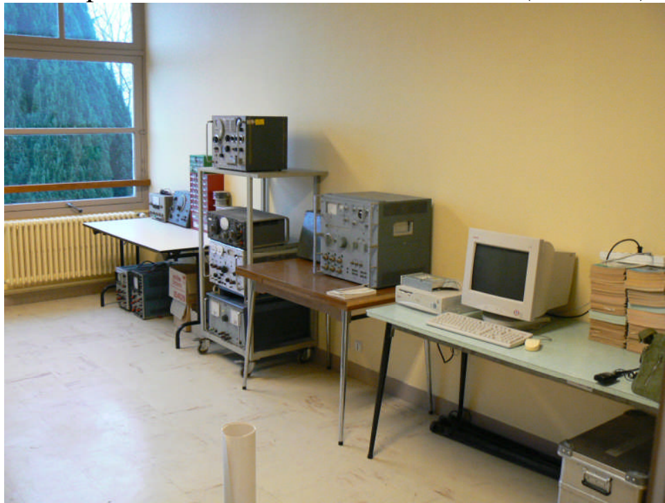
Une vue du Local du REF 50 de St Lô

F6ACH reprend la parole et fait un inventaire des biens (matériels) du REF50.